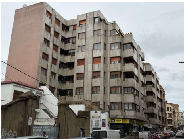
Vista medianera lateral Noreste Roa de la Vega 30