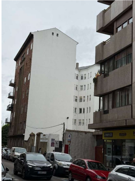
Vista medianera lateral Suroeste con Condesa de Sagasta nº12