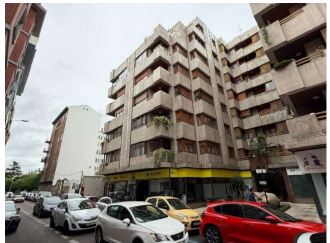
Vista conjunta de edificaciones colindantes

Se procede en este informe a dar cumplimiento a la Ley 21/2013, de 9 de diciembre, de evaluación ambiental, en sus artículos 6 y 29;